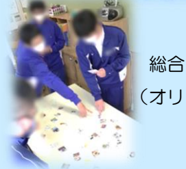
総合的な探究の時間 (オリーブ栽培で 地域おこし)