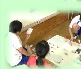
生活単元学習 (平和学習)