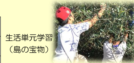
生活単元学習 (島の宝物)