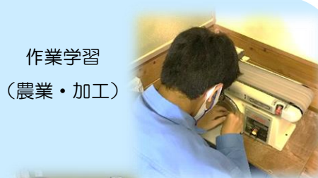
作業学習 (農業・加工)